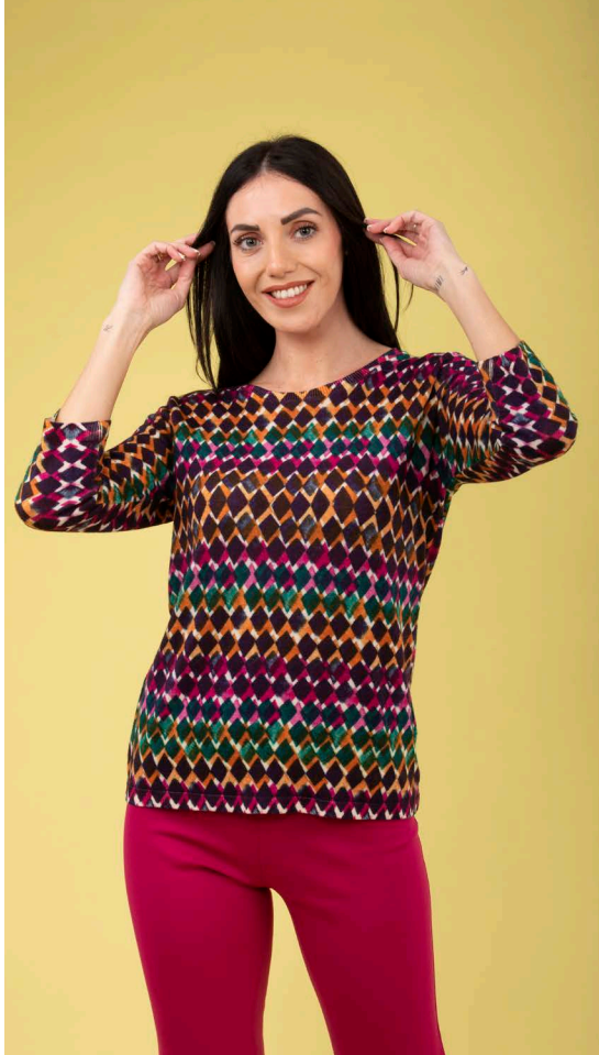
Maglia maniche 3/4 art. N144