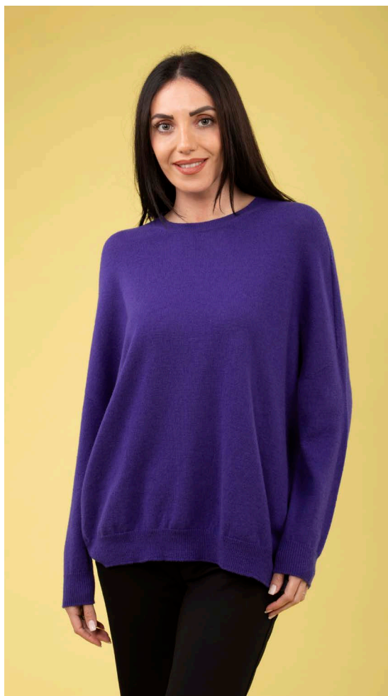
Maglia over art. N504A