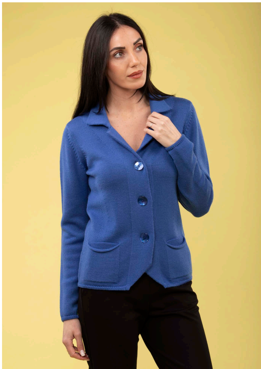
Blazer art. N426B