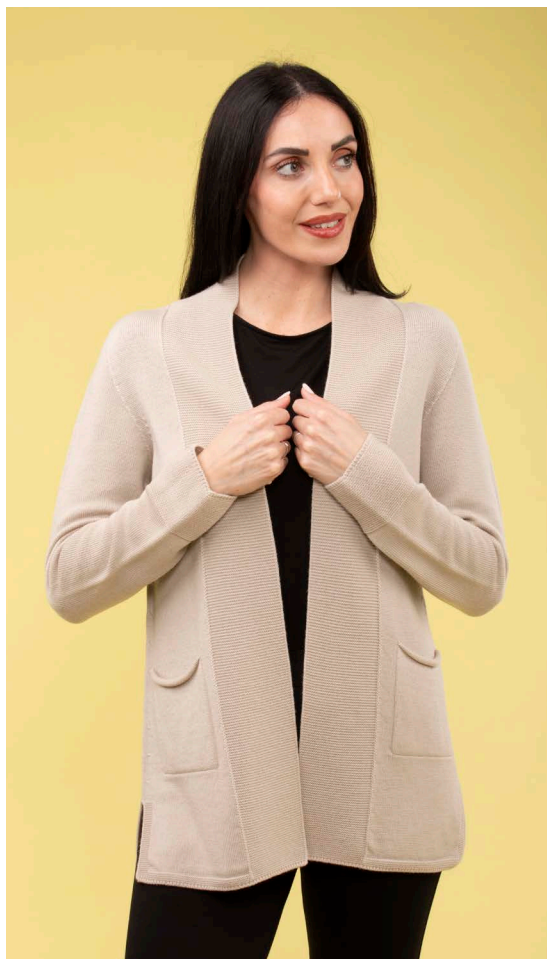
Giacca art. N417B