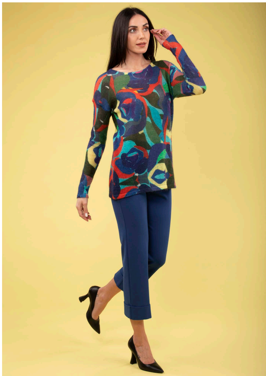
Pantalone art. N705E