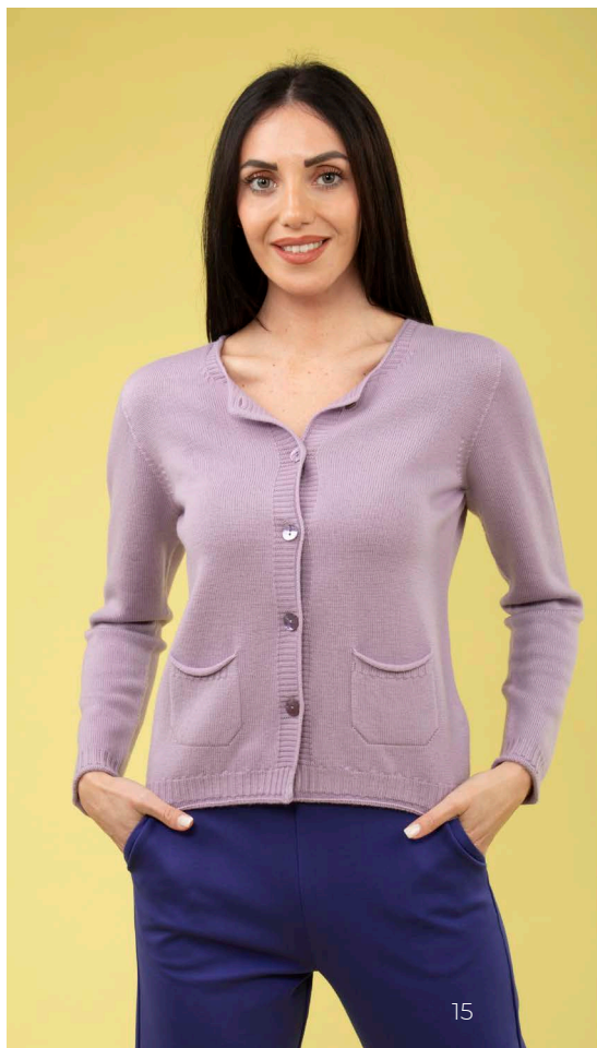
Cardigan art. N413B