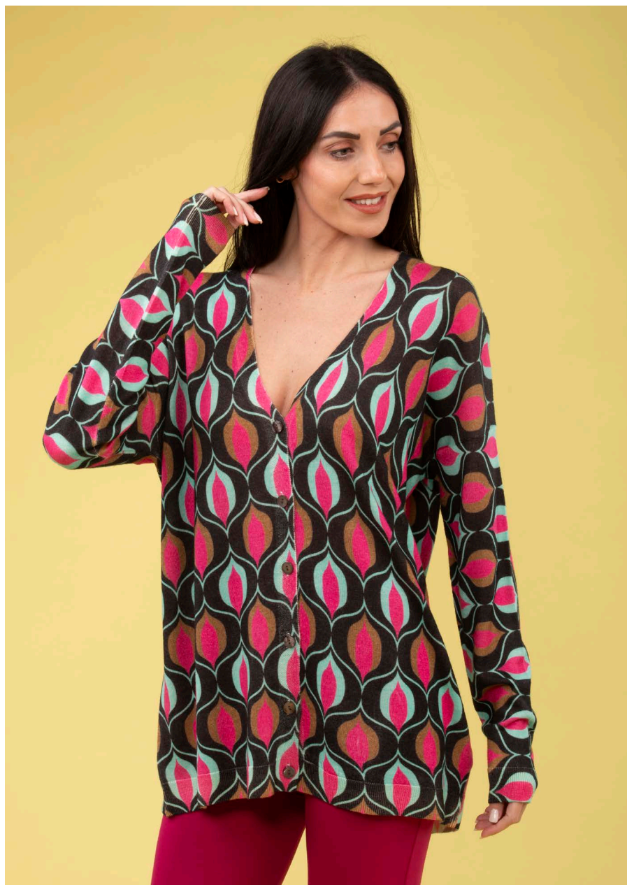
Cardigan lungo art. N153