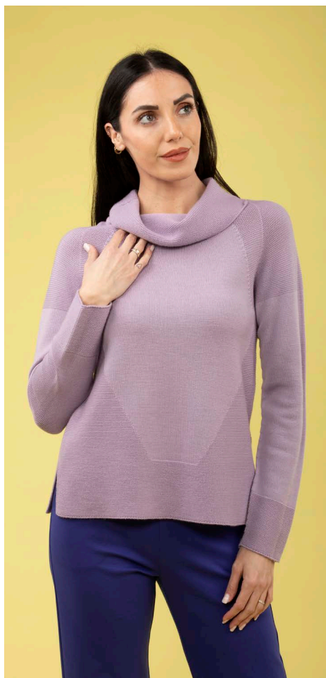
Maglia collo ciambella art. N412B