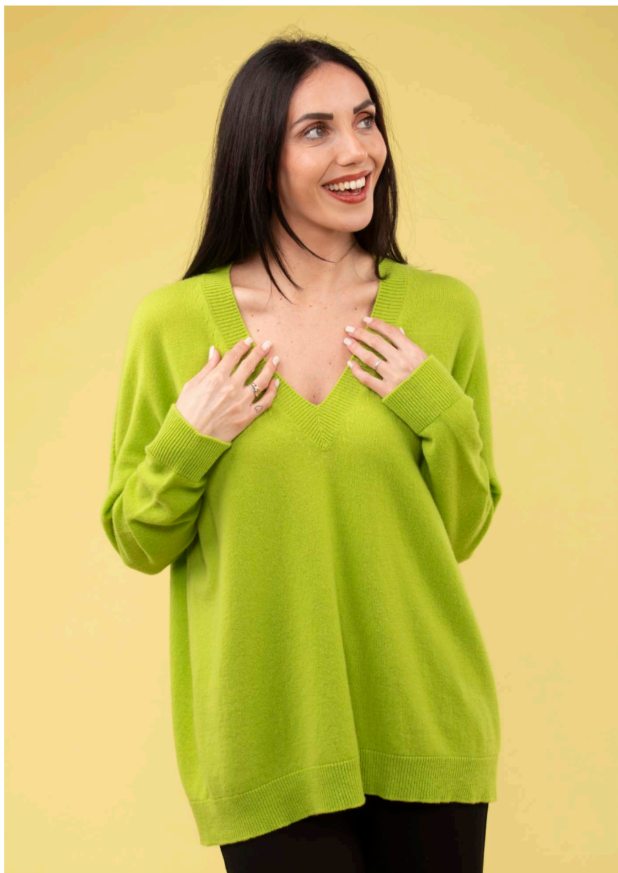
Maglia scollo V over art. N514A