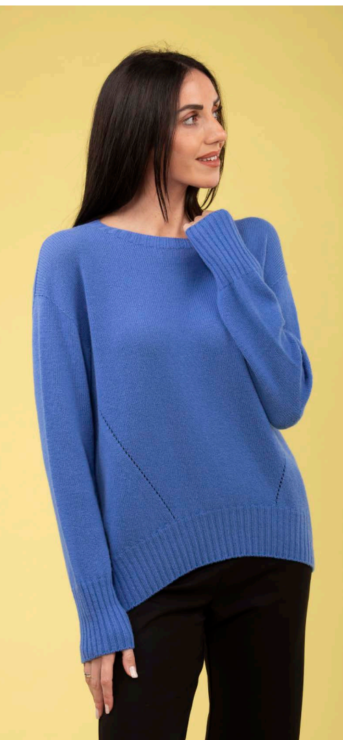
Maglia art. N506A