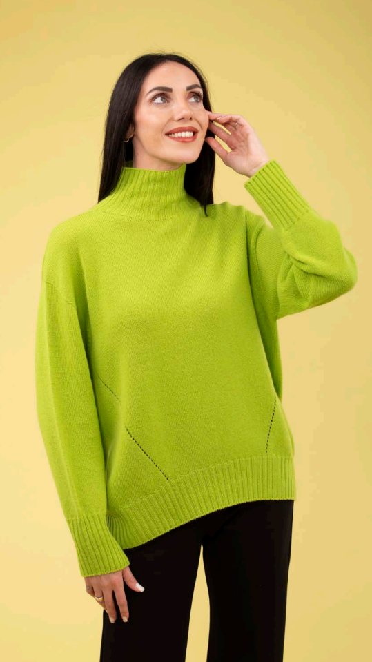
Maglia art. N515A