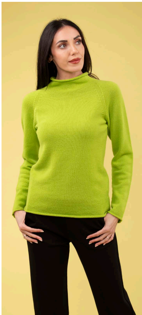
Maglia art. N512A