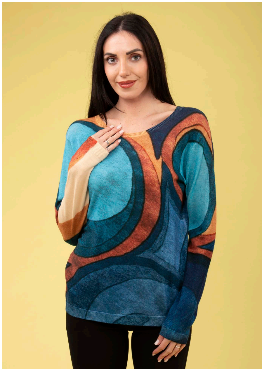
Maglia art. N201