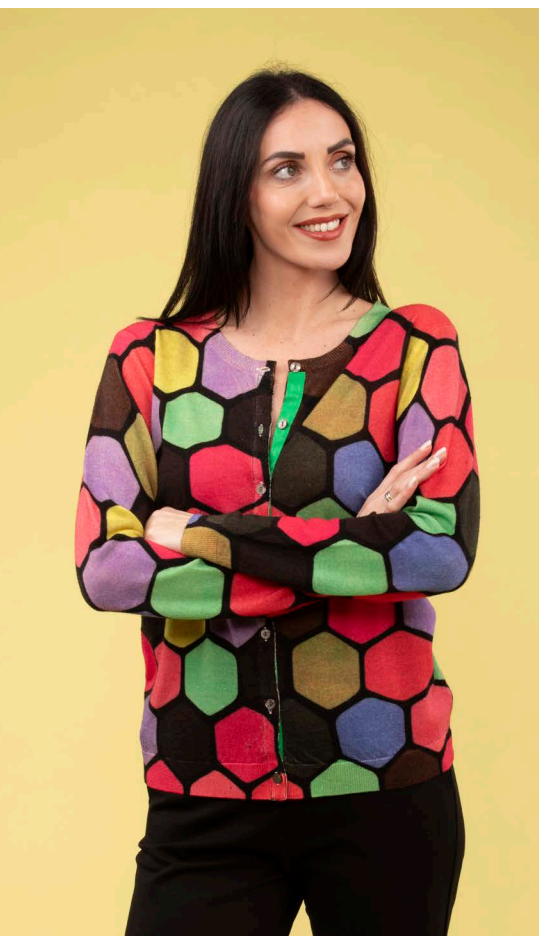
Cardigan art. N112