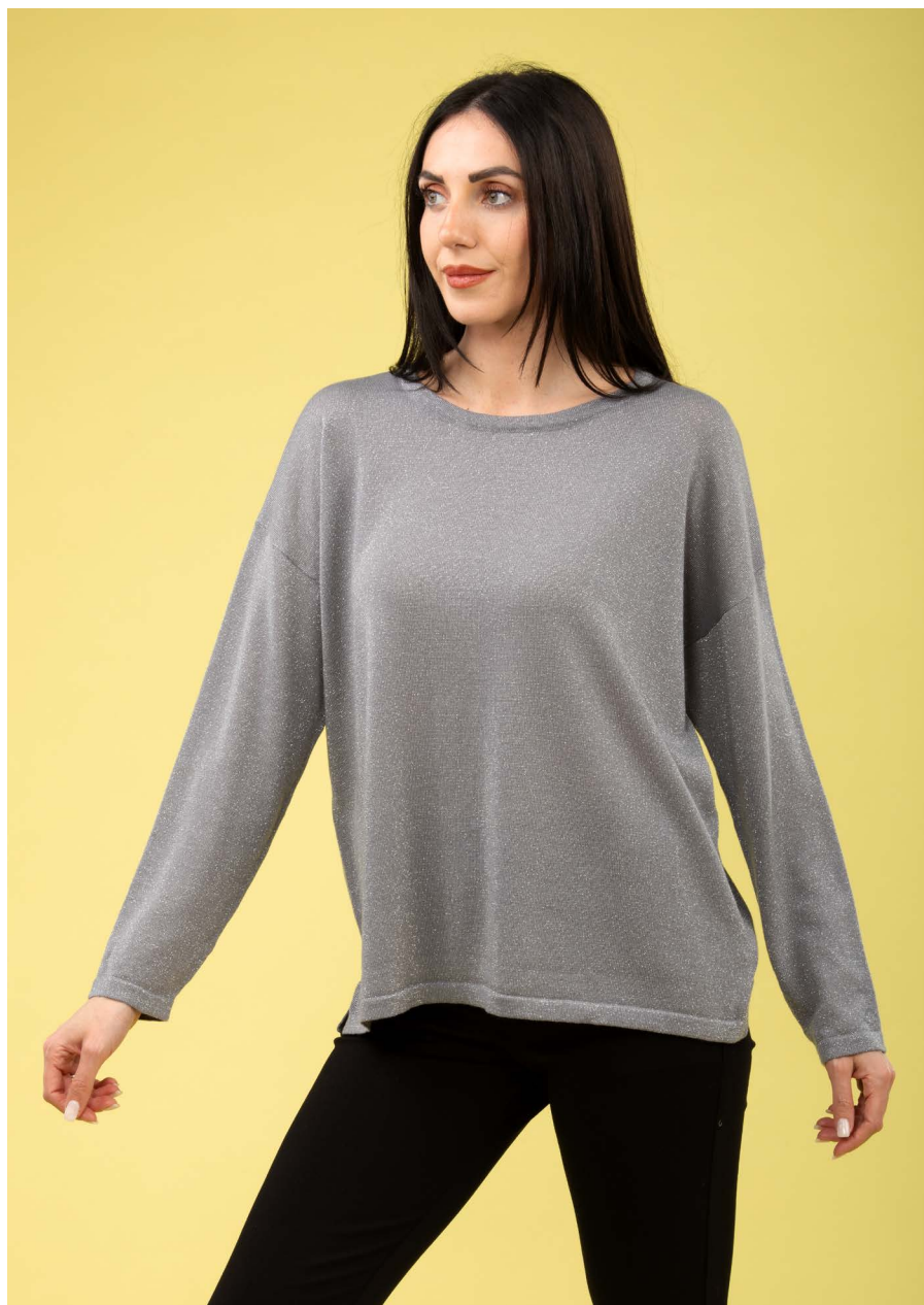
Maglia over lurex art. N271