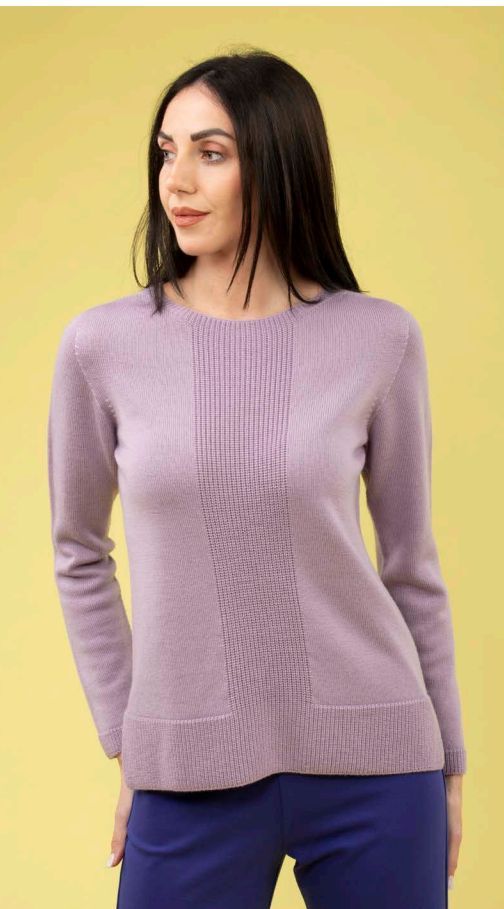
Maglia art. N411B