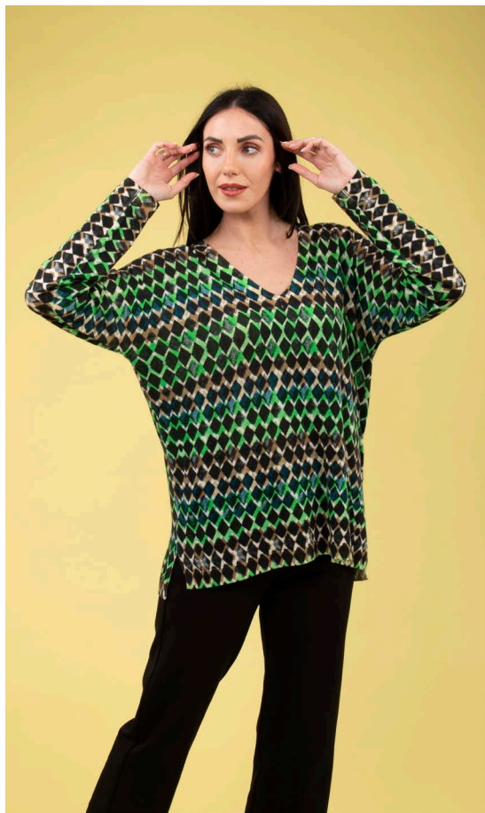
Maglia over scollo V art. N142