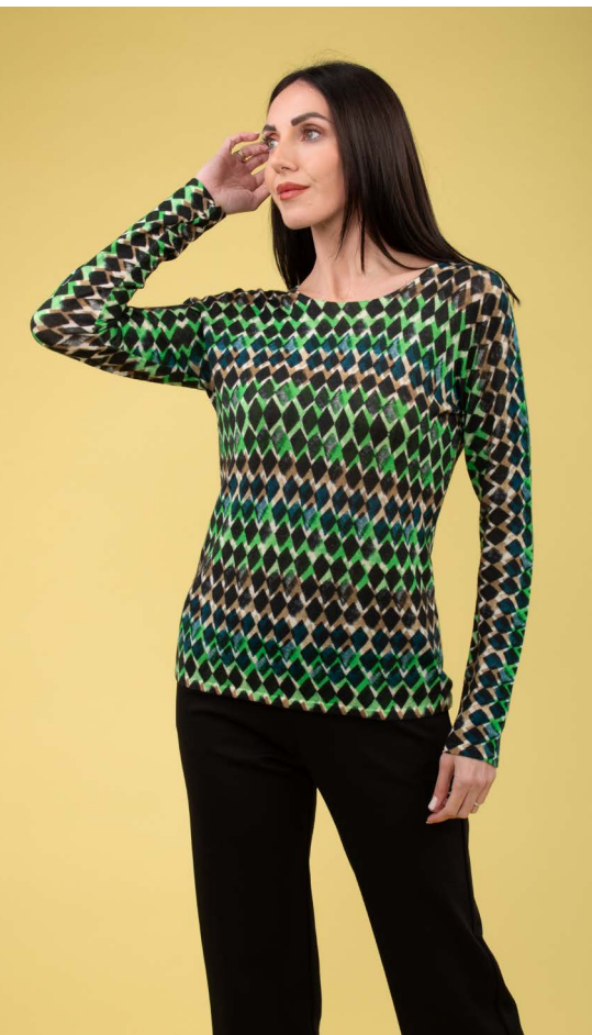
Maglia art. N141