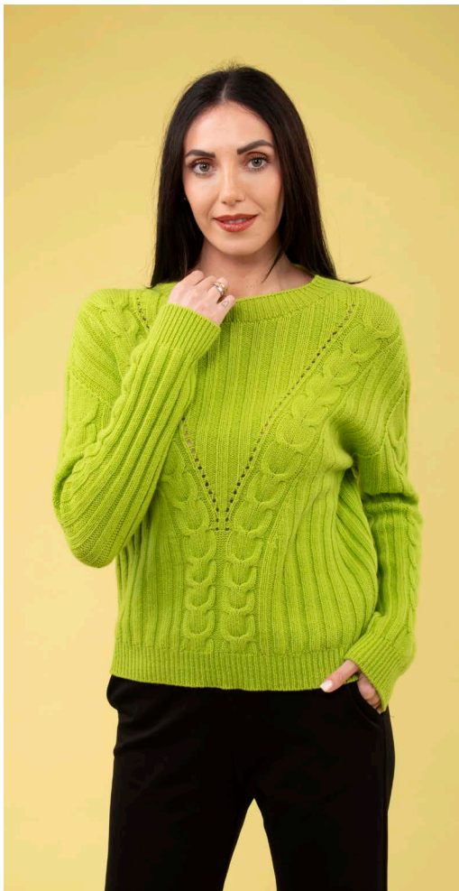
Maglia art. N513A