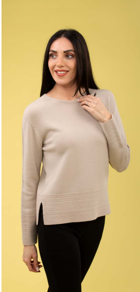
Maglia art. N415B