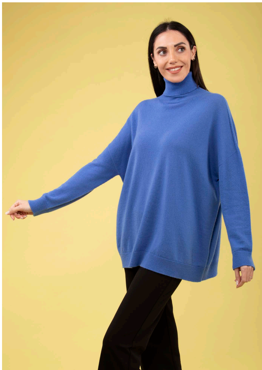
Maglia collo alto over art. N509A