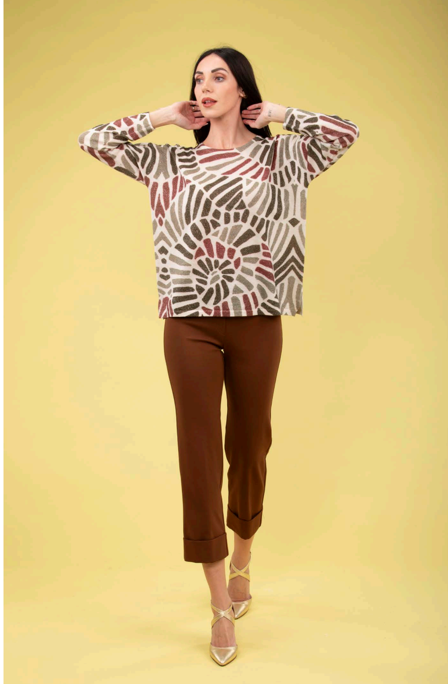
Maglia over lurex art. N241