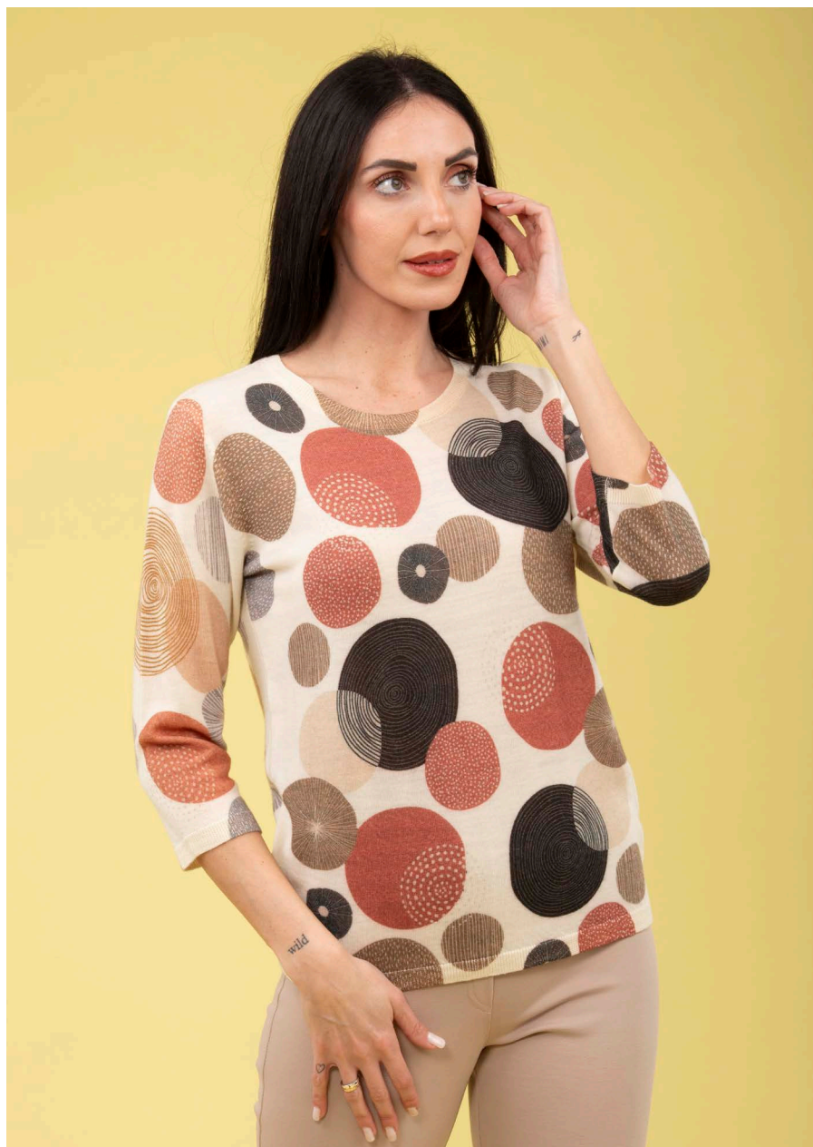
Maglia manica 3/4 art. N193