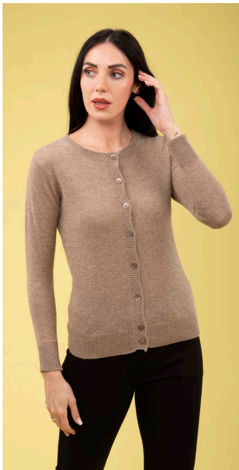
Cardigan 100% cashmere art. N302C