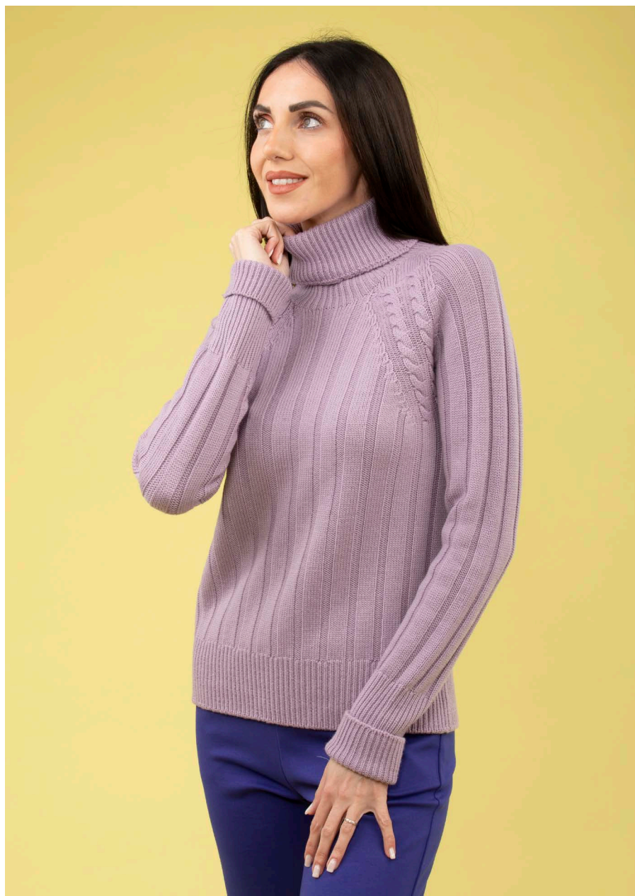
Maglia collo alto art. N414B