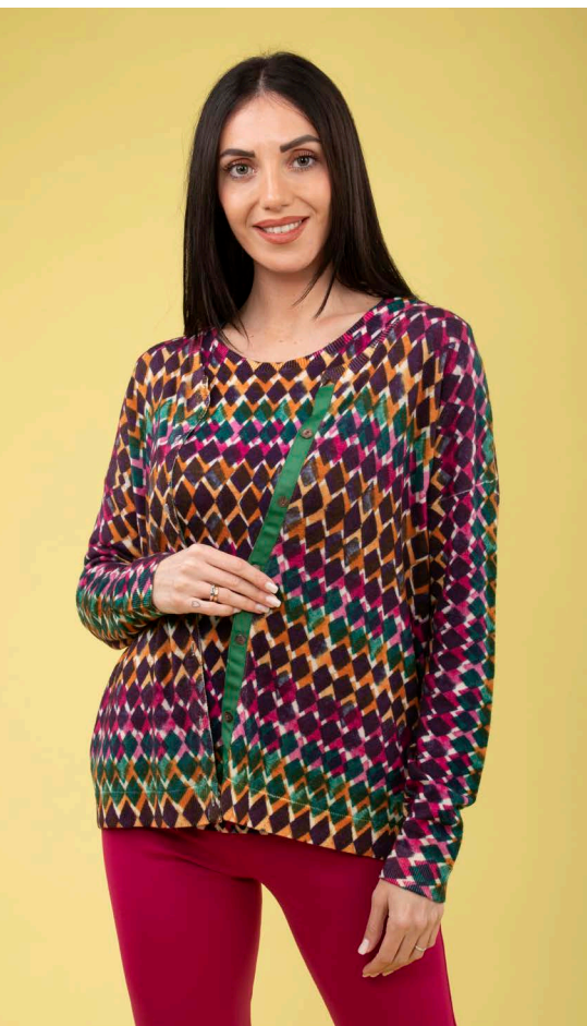
Cardigan spalle scese art. N143