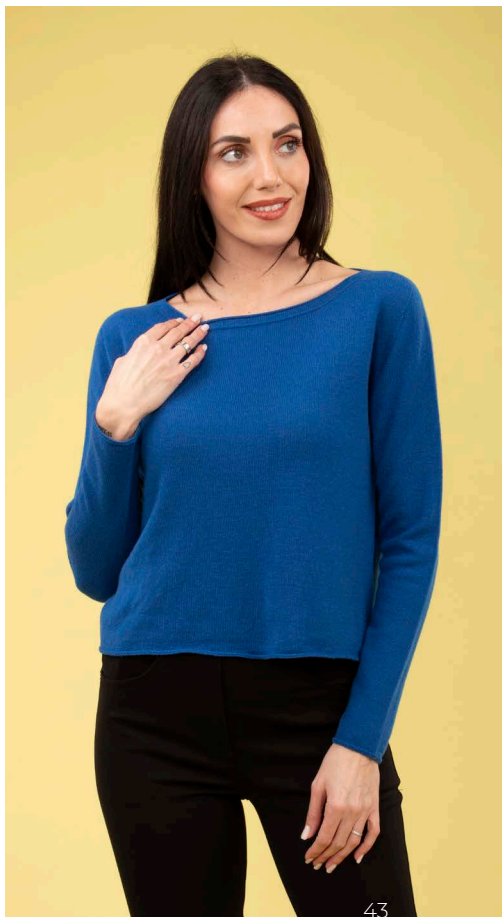
Maglia 100% cashmere art. N309C