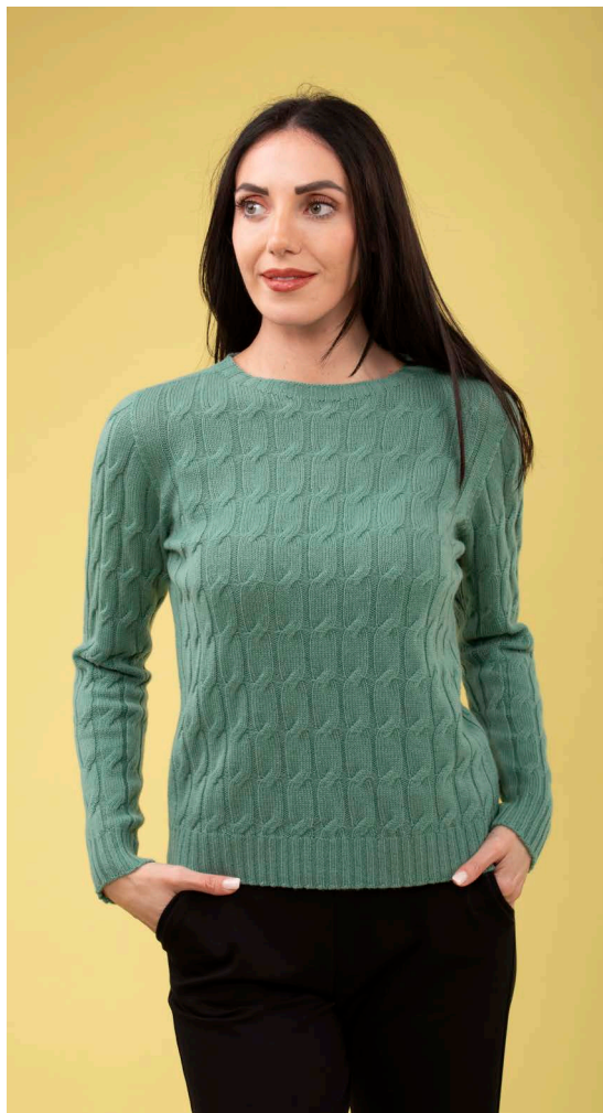
Maglia 100% cashmere art. N305C