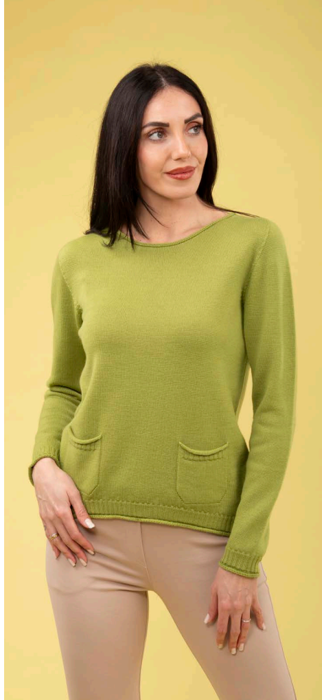
Maglia art. N429B