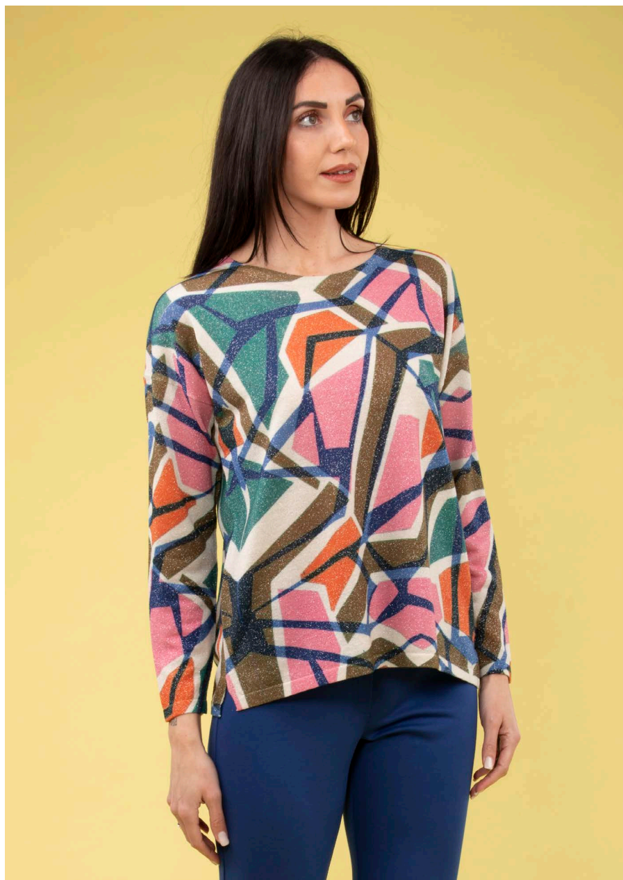
Maglia over lurex art. N261