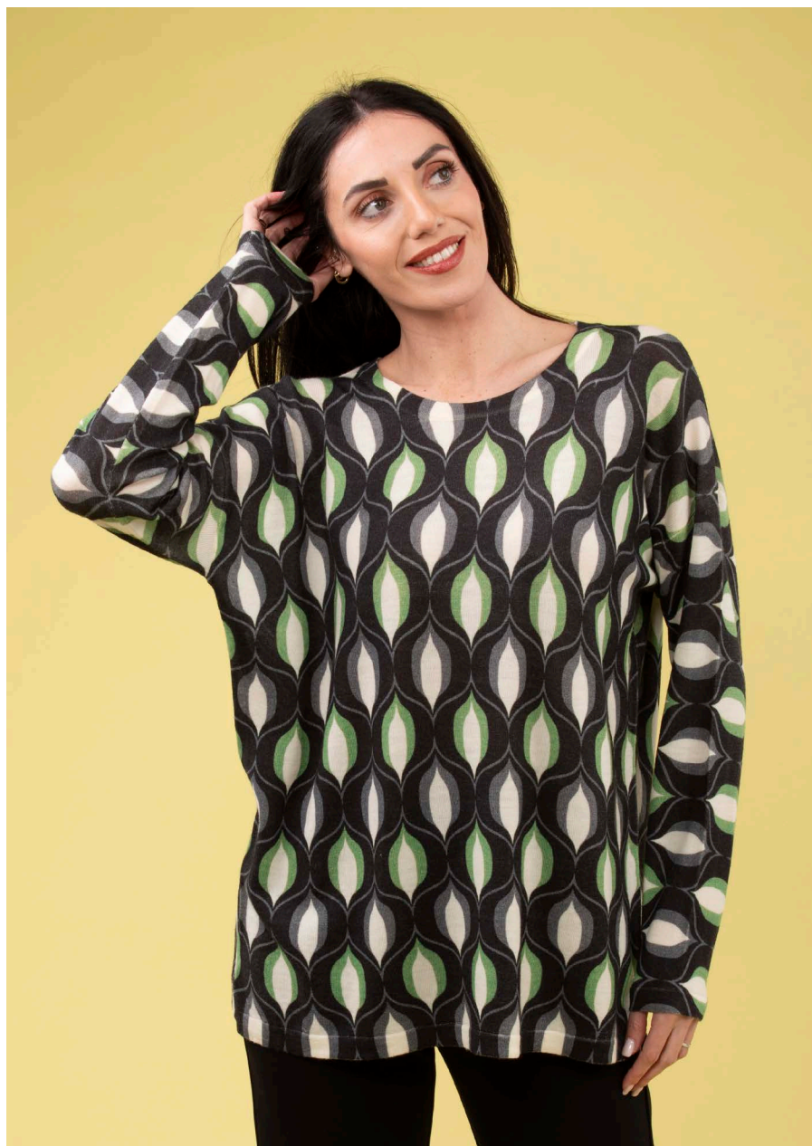
Maglia art. N152