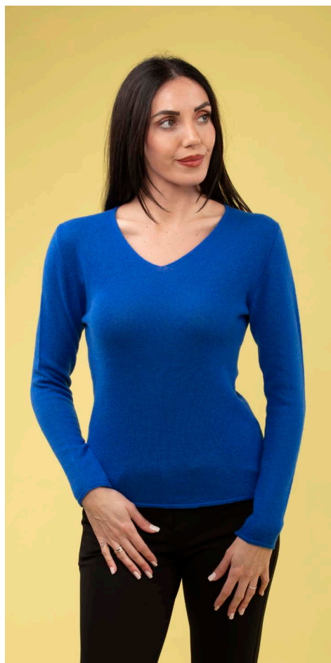
Maglia scollo V 100% cashmere art. N307C