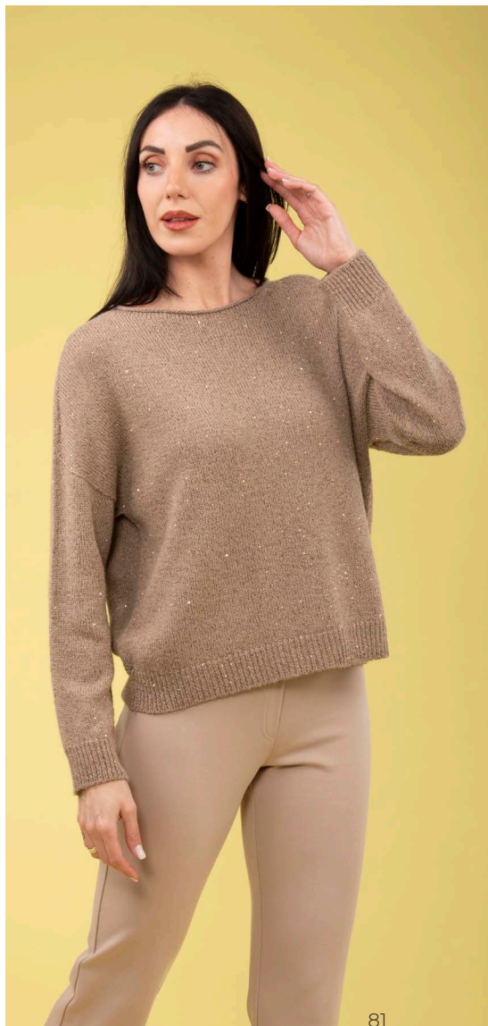
Maglia paillettes art. N602D