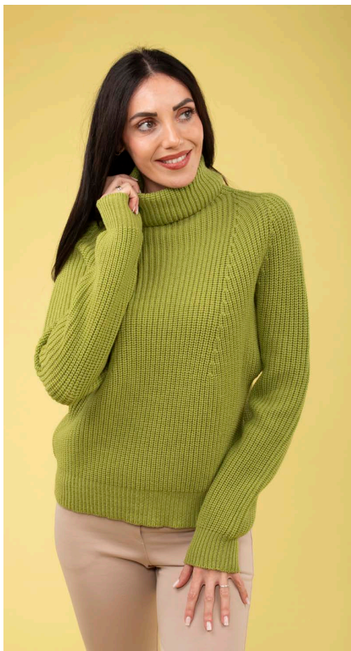
Maglia collo alto art. N428B