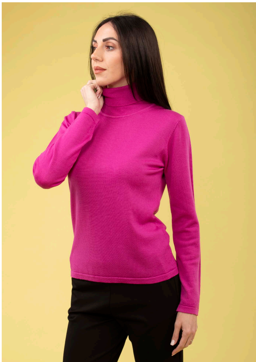
Maglia collo alto art. N405B