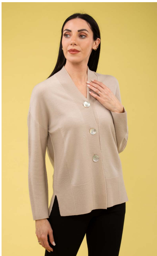
Cardigan 100% lana merinos art. N416B