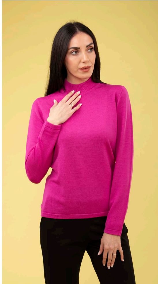
Lupetto art. N403B