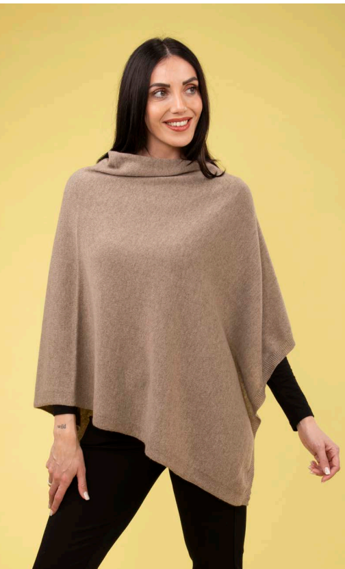
Mantella 100% cashmere art. N303C