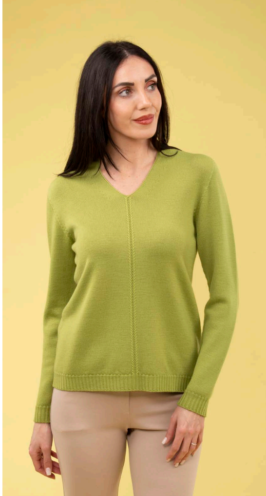
Maglia art. N431B