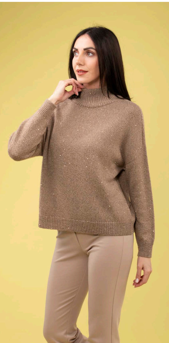
Lupetto paillettes art. N603D