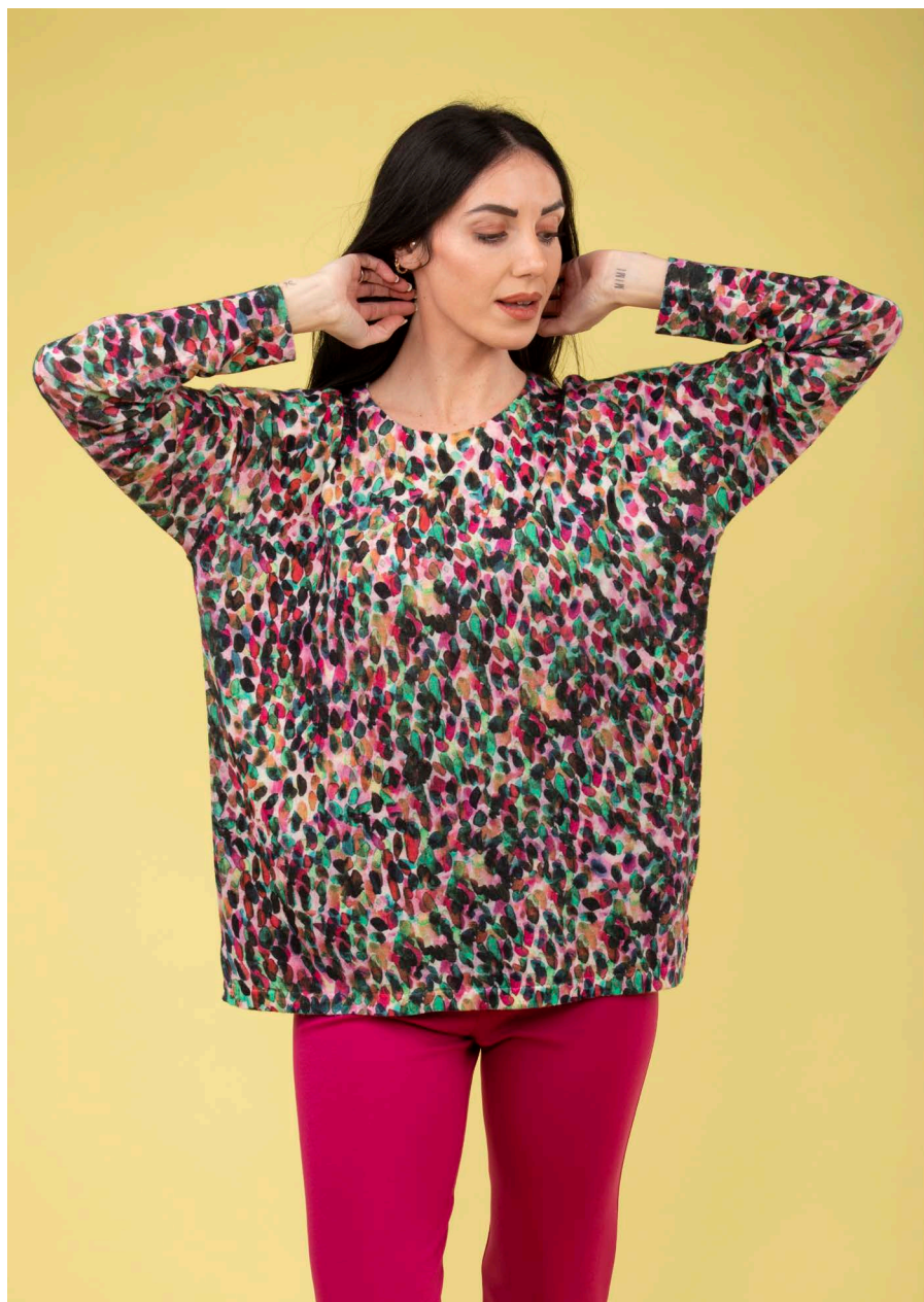
Maglia over art. N122