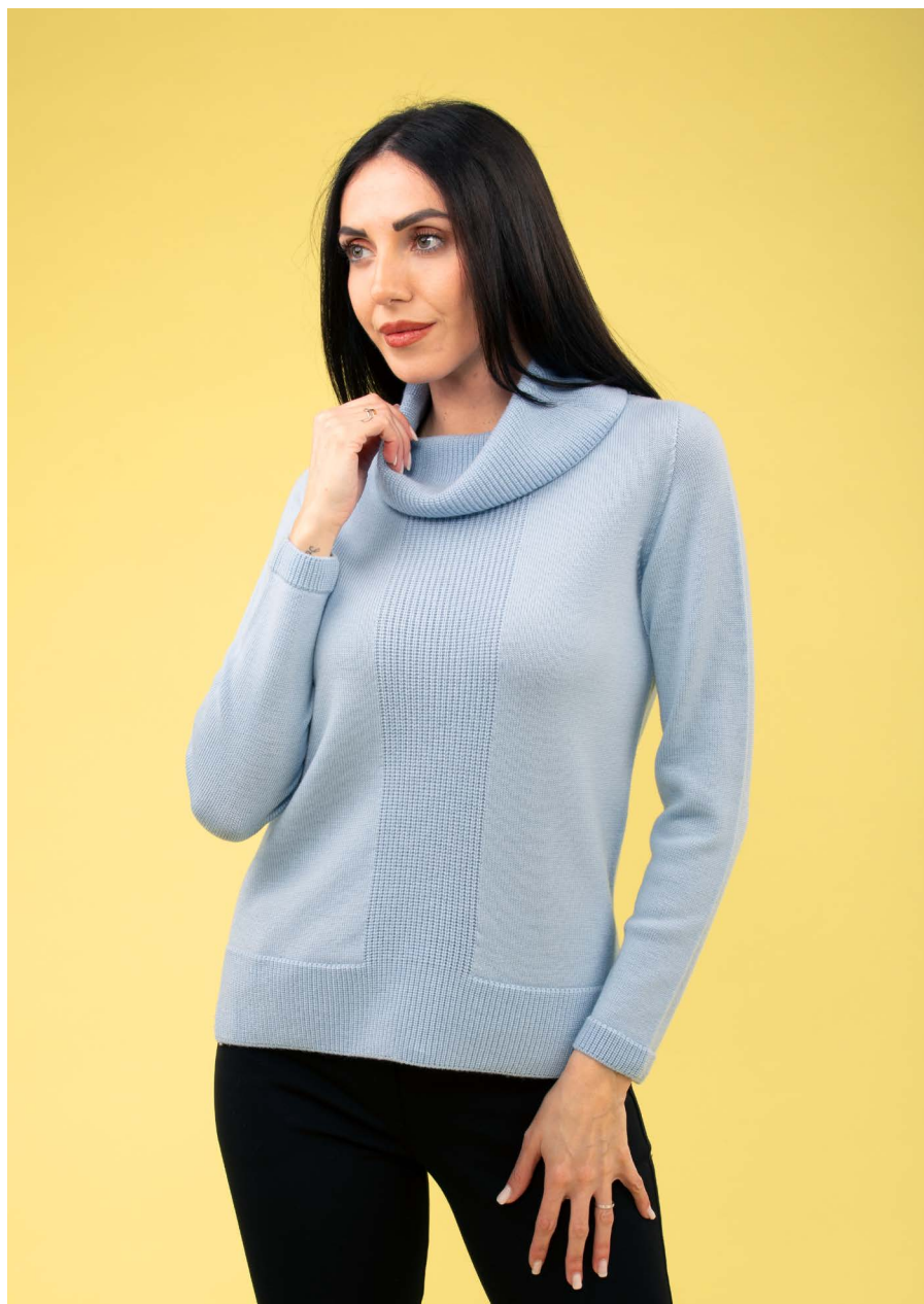
Maglia collo ciambella art. N421B