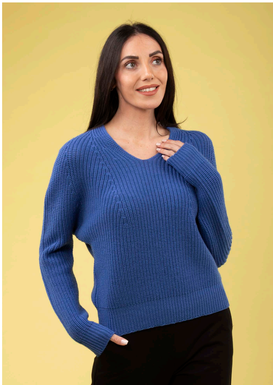
Maglia scollo V art. N427B