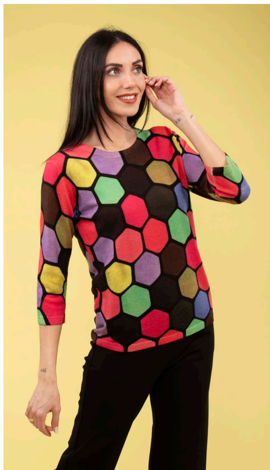
Maglia maniche 3/4 art. N113