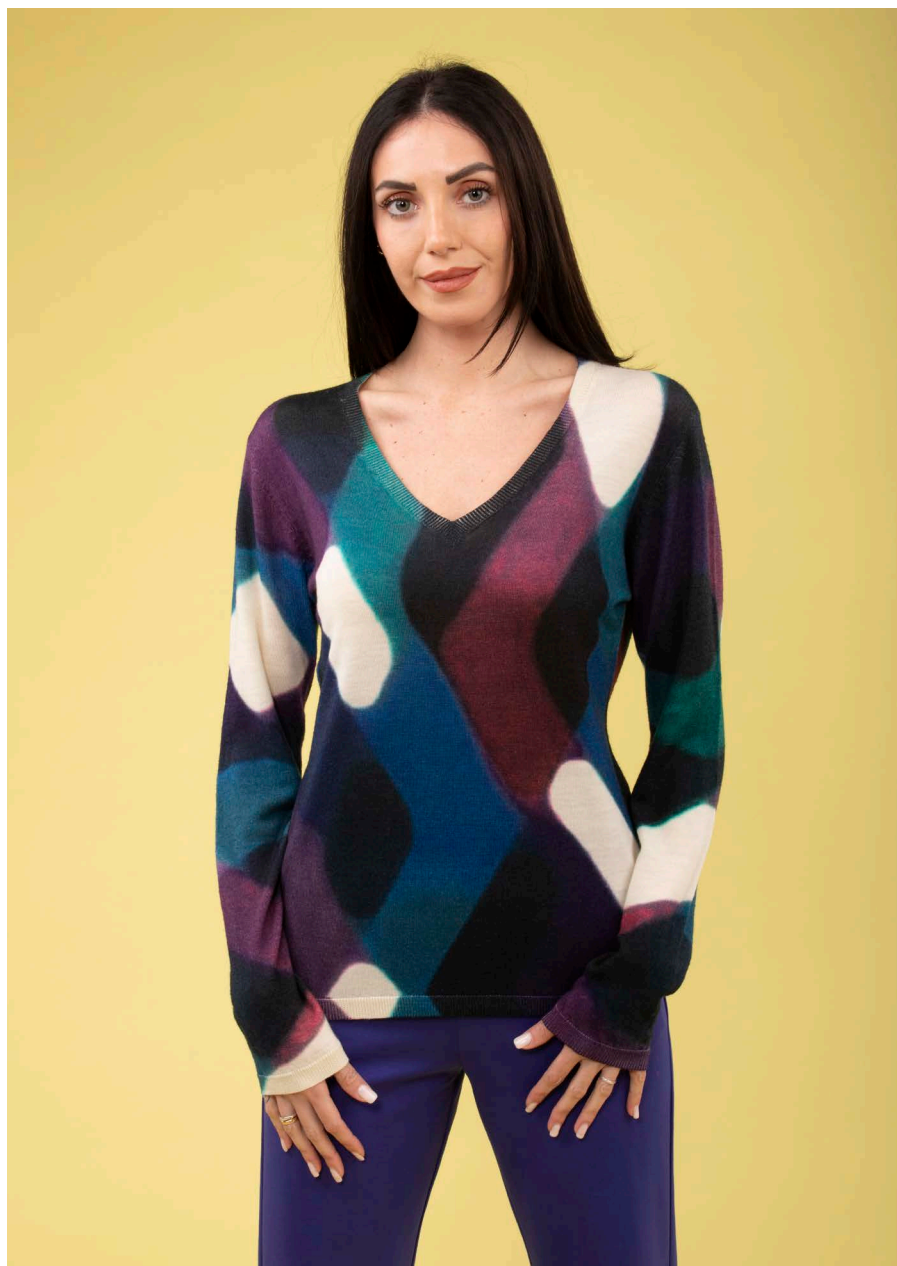
Maglia scollo V art. N131