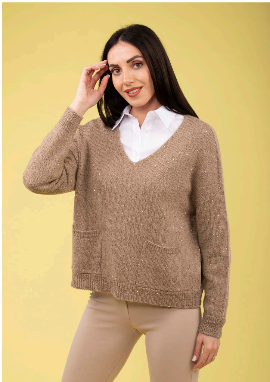
Maglia scollo V paillettes art. N604D