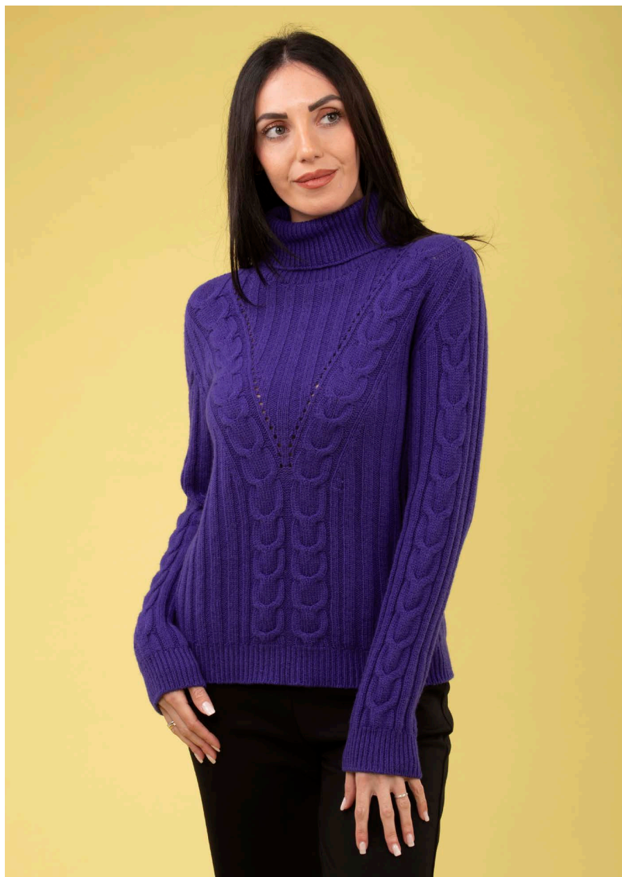
Maglia collo alto art. N502A