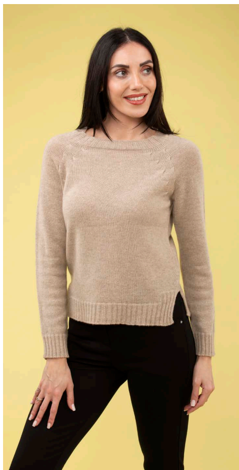
Maglia 100% cashmere art. N301C