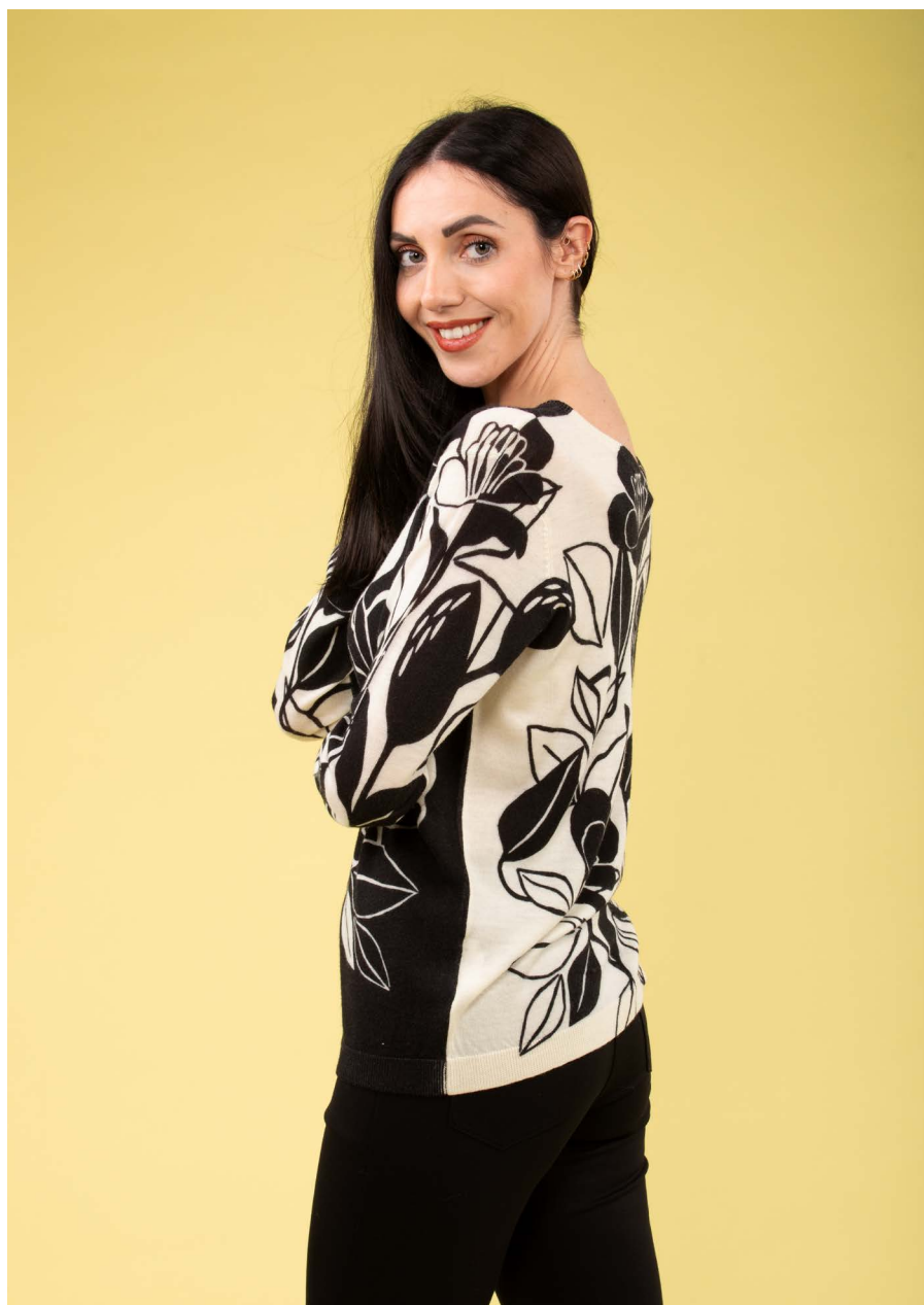
Maglia art. N181